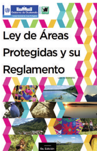
Documento Ley de áreas protegidas

garantizará la creación y protección de parques nacionales, reservas, los refugios naturales y la fauna y la flora que en ellos exista. Es así como nace a la vida jurídica la Ley de Áreas Protegidas, mediante el Decreto Legislativo 4-89. En dicha Ley se establece la creación del Consejo Nacional de Áreas Protegidas como órgano máximo de dirección y encargado de aplicación de la misma. En dicho cuerpo normativo se resalta el principio constitucional de protección ambiental al indicar en su artículo 1 que la diversidad biológica, es parte integral del patrimonio natural de los guatemaltecos y que por lo tanto, se declara de interés nacional su conservación por medio de áreas protegidas debidamente declaradas y administradas. Es así como nace el Sistema Guatemalteco de Áreas Protegidas -SIGAP-, el cual está integrado por todas las áreas protegidas y entidades que las administran, y cuya organización y características establece dicha Ley, a fin de lograr los objetivos de la misma en pro de la conservación, rehabilitación, mejoramiento y protección de los recursos naturales del país, y la diversidad biológica.