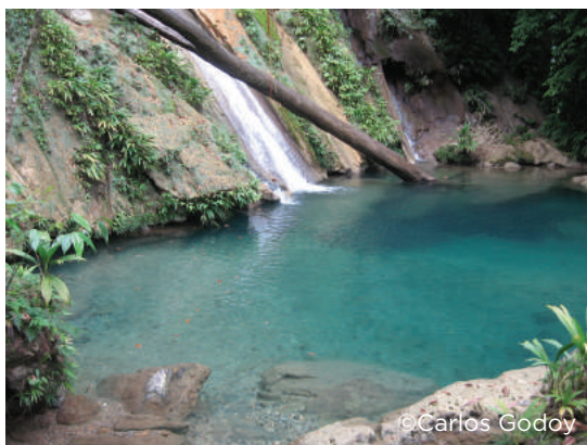
Reserva Protectora de Manantiales Cerro San Gil

POLÍTICA SOBRE LA ACTIVIDAD DE VISITA EN ÁREAS PROTEGIDAS