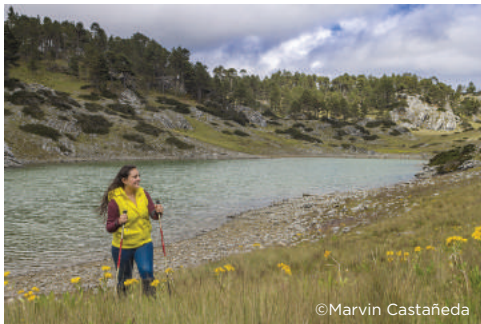
Visita en áreas protegidas

Corresponsabilidad y Participación Equitativa: la actividad de visita en áreas protegidas involucra varios actores y debe abordarse en forma descentralizada, promoviendo la participación activa del Estado y la sociedad civil.