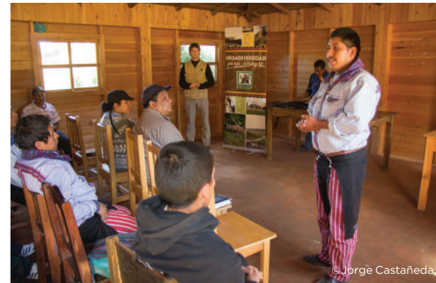
Entrevista con encargados

La oferta turística de un destino se conforma de tres partes esenciales: