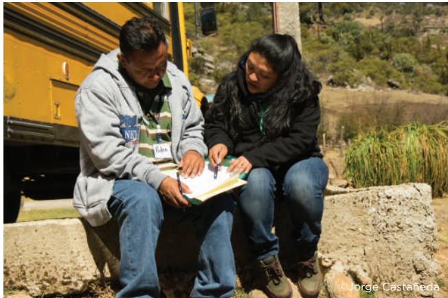
Visita y evaluación de campo

Dicho formato se puede modificar o adaptar al área. Éste incluye instrucciones de llenado para cada sección incluyendo cuadros y gráficos.