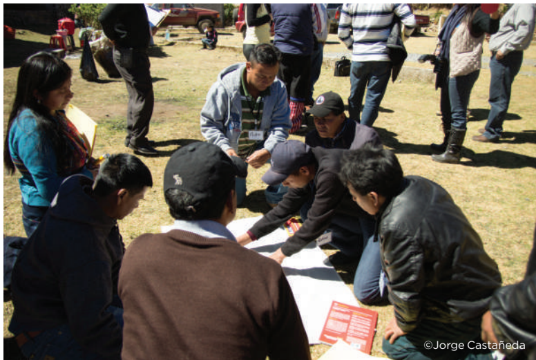
Evaluación de área

Cuando un área es deficiente en la parte de estructura o de administración, esto se reflejará en la gráfica como áreas en las que se debe poner especial atención en planificación e inversión. El área puede tener potencial turístico siempre y cuando se tengan los recursos para invertir en estos dos aspectos. Sin embargo, si el área presentara baja calificación en la parte de atractivos y actividades se considera que el área NO tiene potencial turístico (ya que son elementos que no se pueden crear como en el caso de la estructura por ejemplo).