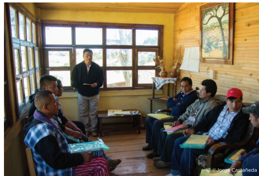
Entrevista a personal administrativo

Llenar el cuadro de aspectos administrativos en base a la entrevista a personal administrativo y a la evaluación de campo. Tanto la ficha de entrevista como este formato pueden ser adaptados según el área (agregar secciones o quitar elementos que no aplican: si alguno de los elementos no aplica ni se considera algo potencial se debe eliminar de la lista para evitar alterar la calificación real. Si se elimina o agrega algún elemento de esta lista también se debe agregar o eliminar del cuadro de resumen No.11).