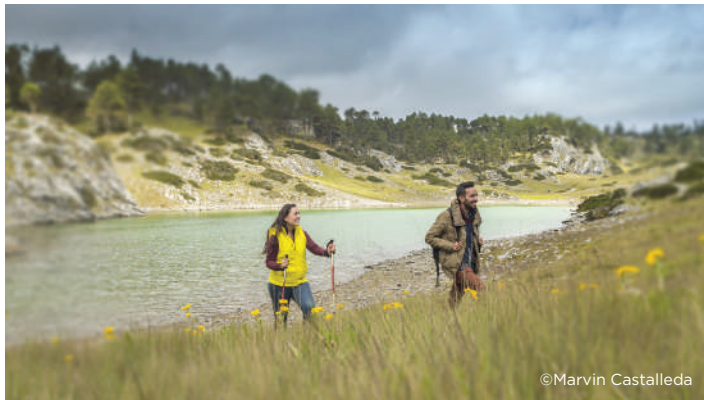
Recorrido del área