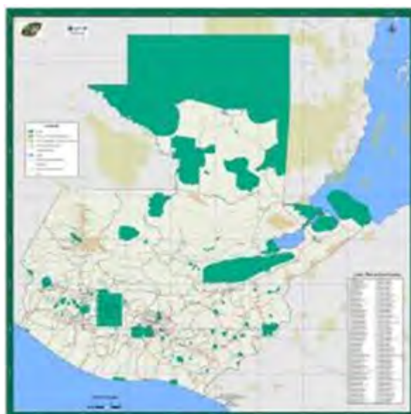
Figura 1. Mapa de áreas protegidas